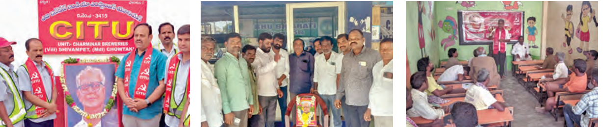
నివాళులు అర్పిస్తున్న దృశ్యం