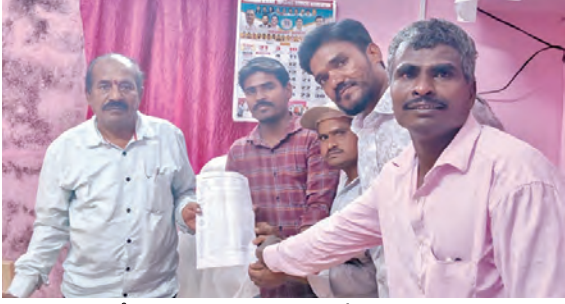
తహసీల్దార్ కు వినతిపత్రం అందజేస్తున్న విఆర్ఎలు