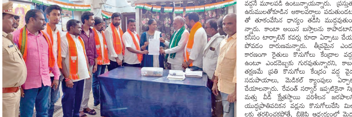
తహసీల్దార్ కు వినతి పత్రం అందిస్తున్న బిజెపి నాయకులు